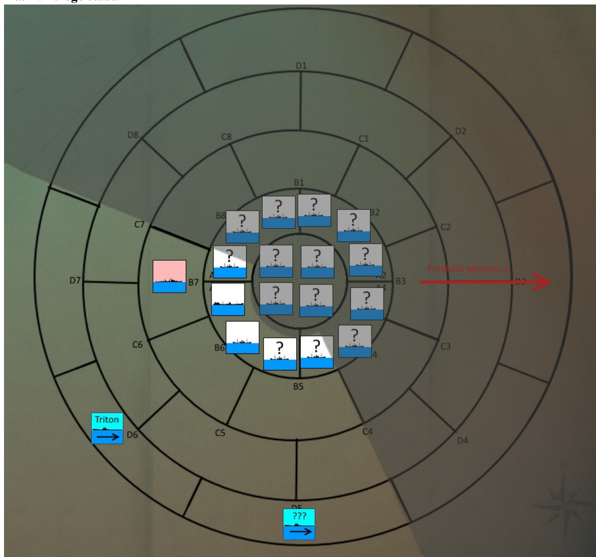
USS Triton podchodzący do konwoju wraz z nieznanym okrętem podwodnym

Atak wilczym stadem różni się od standardowej procedury ataku. Gdy Amerykanie zaczną prowadzić działania wilczymi stadami (w zależności od postępów kampanii około roku 1943), zanim gracz otrzyma ekran spotkania, okręt podwodny musi zająć pozycję do ataku na mapie taktycznej. Mapa taktyczna jest podzielona na pola rozłożone w okręgu względem konwoju oraz pola zewnętrzne (poza konwojem). Na ekranie znajdują się: